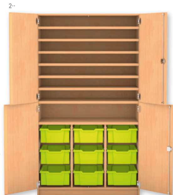
Abb.: Dekor Buche hell

1· Bastelschrank, 4 Halbtüren, 8 Fachböden, davon 6 höhenverstellbar, 18 kleine Boxen