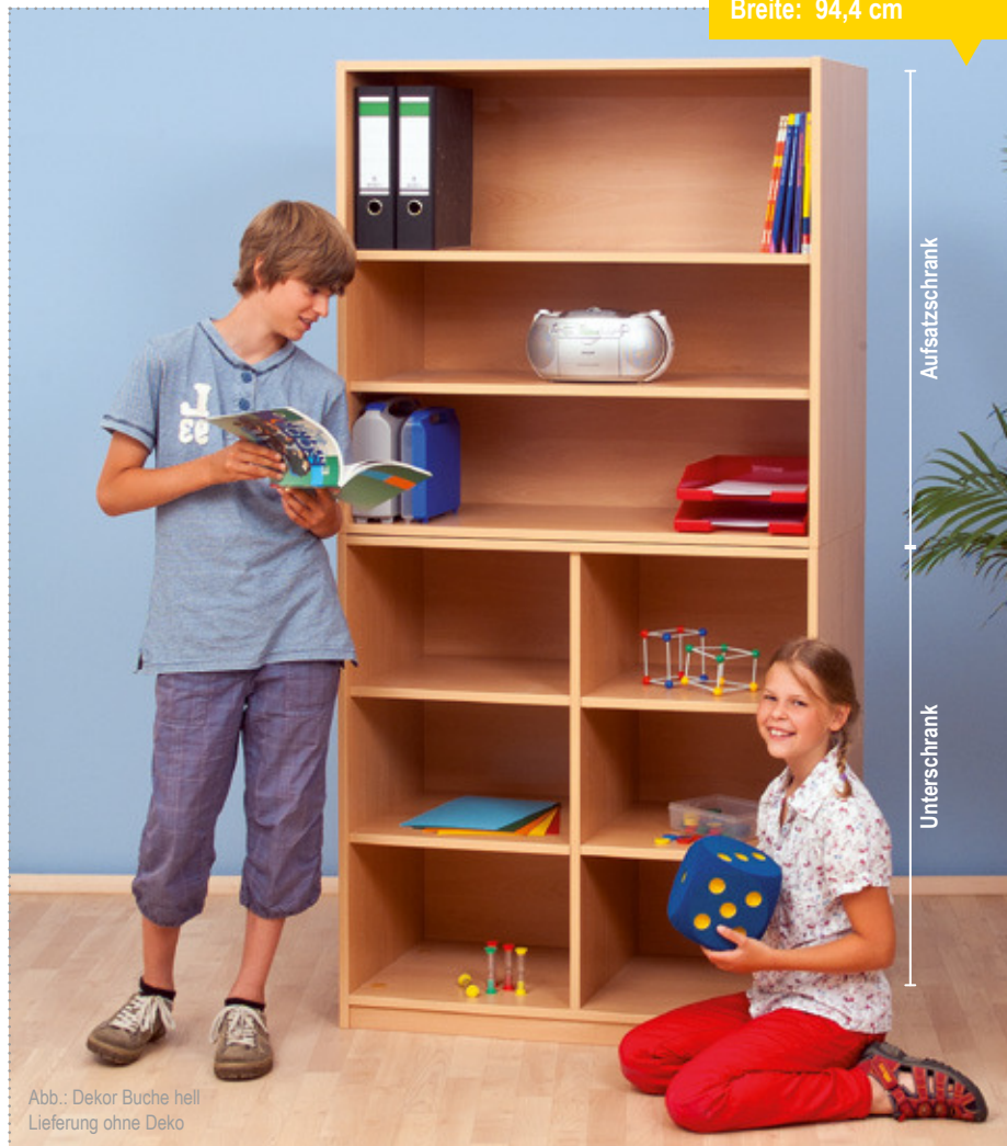
Abb.: Dekor Buche hell Lieferung ohne Deko