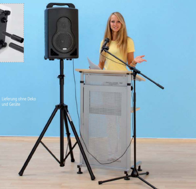
Lieferung ohne Deko und Geräte